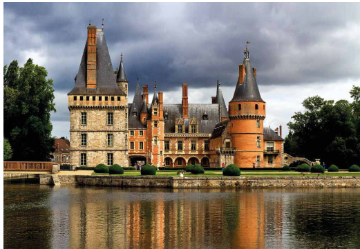
Château de Maintenon, Eure-et-Loir

Renseignements et billetterie : 02 37 33 02 10 theatre-en-pieces@wanadoo.fr | www.theatre-en-pieces.fr