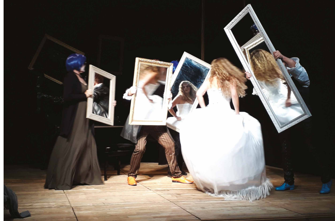
Conception : Page de Marque communication - 02.38.33.27.02